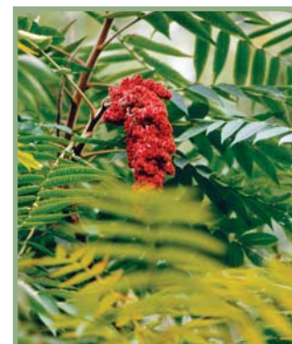
Sumac vinaigrier

L'inflammation de la peau est le résultat de la réponse immunitaire du corps humain aux cellules contaminées. La dermatite n'est donc pas transmise à un autre individu par le contact des plaies, sauf si l'urushiol est encore présent sur la surface de la peau. Un grand nombre d'animaux et d'oiseaux sont complètement insensibles, parce que leur système immunitaire est différent de celui des humains.