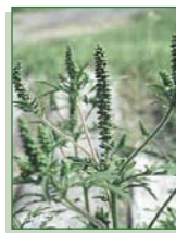
HERBE À POUX

Il ne faut pas confondre l'herbe à la puce et l'herbe à poux. Le pollen de cette dernière est la principale cause de rhinite allergique saisonnière, communément appelée rhume des foins. Contrairement à l'herbe à la puce, on peut sans danger arracher l'herbe à poux à mains nues.